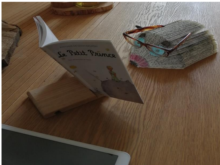
Harry l'intello lit « le petit Prince »

Voici le retour d'une de nos lectrices qui vous présente Harry le Héri dans différentes situations :